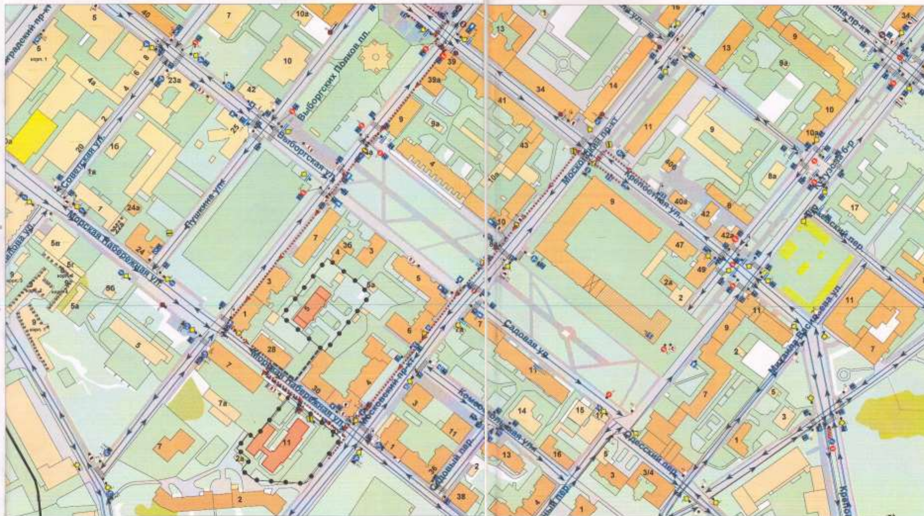
Схема организации дорожного движения в непосредственной близости от образовательного учреждения с размещением соответствующих технических средств, маршруты движения детей и расположение парковочных мест