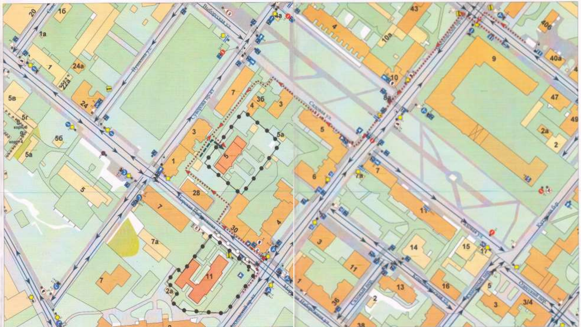
Схема организации дорожного движения в непосредственной близости от образовательного учреждения с размещением соответствующих технических средств, маршруты движения детей и расположение парковочных мест

- образовательное учреждение - жилищная застройка